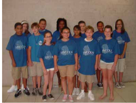
Antiguos estudiantes de 6 o grado que dirigieron la gira