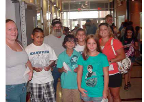
Padres y sus estudiantes en la gira de la EIL.